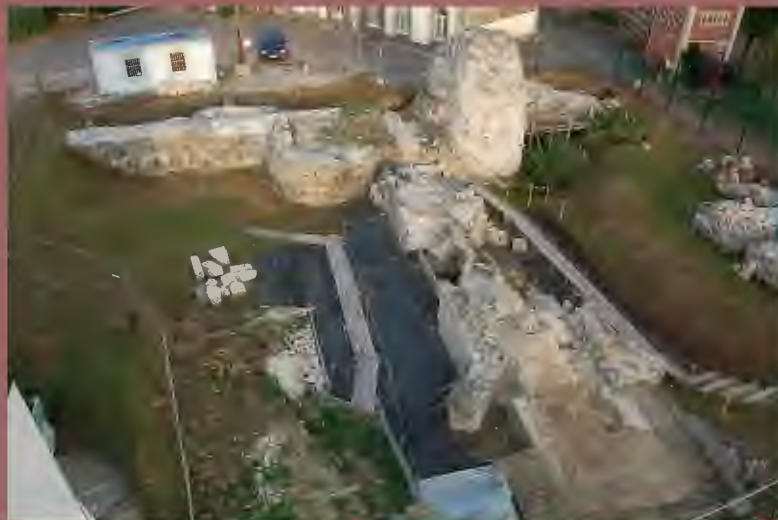
Porte aux Cerfs de Harfleur