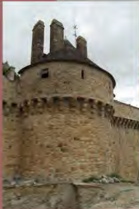
Tour de l'Arcade