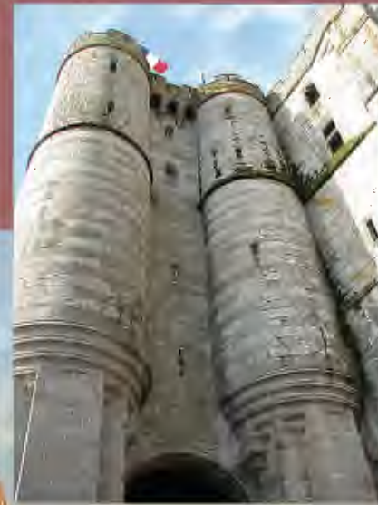
Châtelet de l'abbaye et Tour du Nord