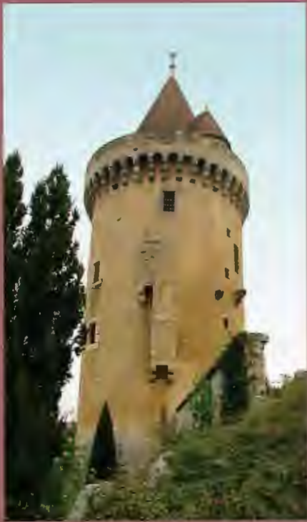
Tour Marguerite d'Argentan