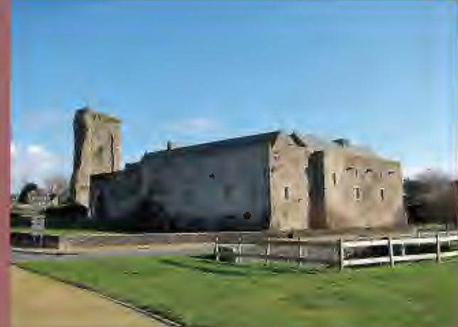
Tour carrée navarraise de Reigneville

Château de Saint-Sauveur-le-Vicomte Tour Cigogne | Tour Hollande | Logis Robessart | Tour d'Aillet