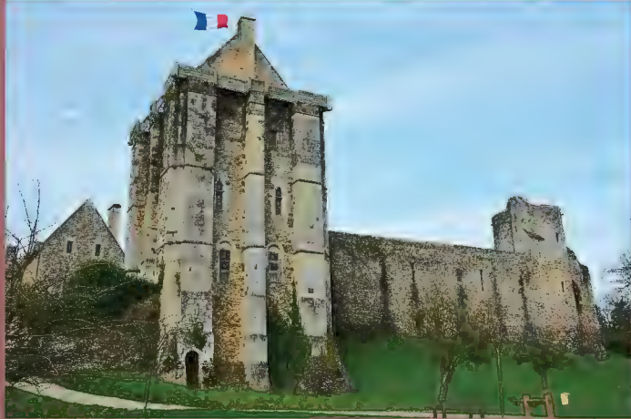
Tour carrée anglaise de Saint-Sauveur