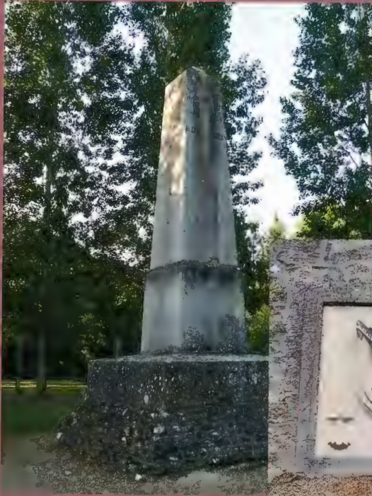
Du Guesclin et Jeanne d'Arc