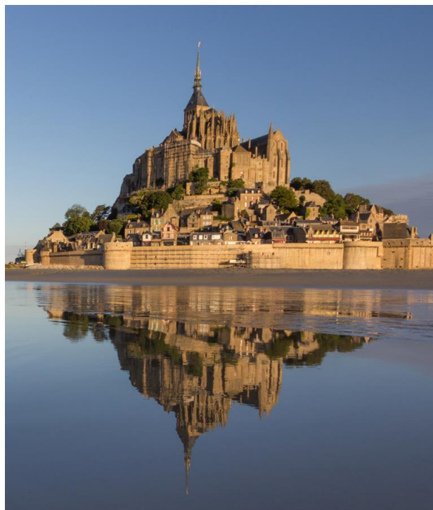
Le Mont-Saint-Michel et sa Baie