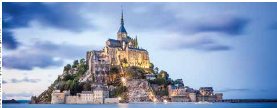
Daimler Fachinger Architects/SBP