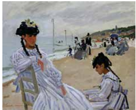
© Monet - Sur la plage à Trouville

Tierra de expresión de los impresionistas, Normandía también es puesta en valor por artistas locales como Kévin Cadinot que presenta una puesta en escena del Fuerte de Tourneville sobre el tema de las auroras. En otro registro, Benjamin Deroche se apropia de la leyenda del lobo verde en Jumièges para proponer un cuento fotográfico.