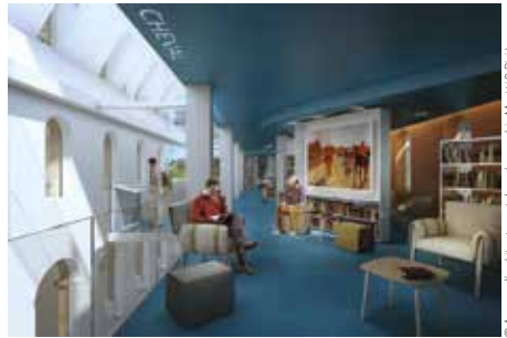
© Agence d'architecture et de scénographie Moatti & Rivière - Les Franciscaines - Deauville