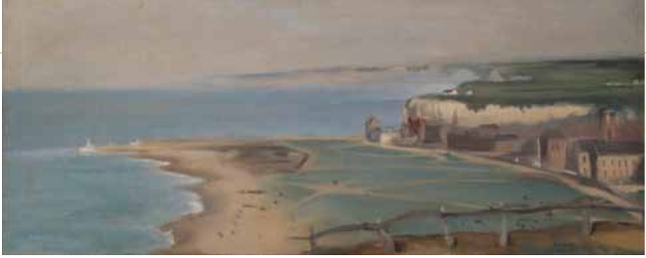
© Eva Gonzalès - Plage de Dieppe vue depuis la Falaise Ouest

sol, momento en el que la luz artificial que ilumina a las calles y a los monumentos, modifica la percepción de los artistas y ofrece experiencias visuales increíbles.