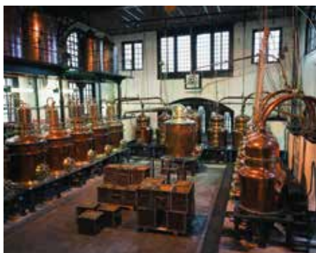
© Palais Benedictine - Fécamp - France