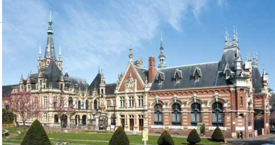
© Palais Benedictine - Fécamp - France