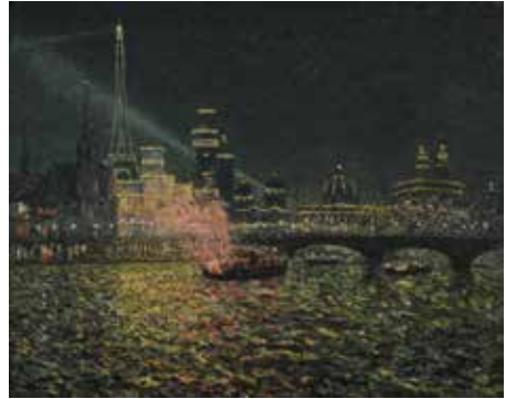
© Maxime Maufra - Féerinocturne. Exposition Universelle 1900