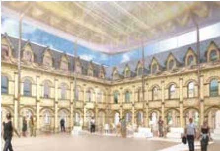
© Agence d'architecture et de scénographie Moatti & Rivière - Les Franciscaines - Deauville

En este nuevo espacio cultural, se mezclan diferentes espacios, proponiendo por ejemplo una superficie dedicada a la exposición en el corazón de la mediateca, con acceso libre, y estructurada alrededor de temas muy impor-